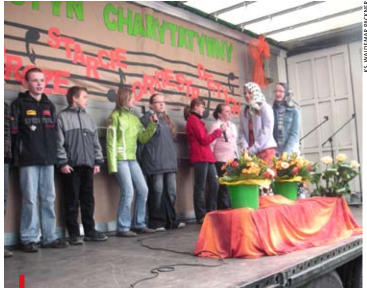
Program „Po śląsku, czyli po naszymu” wykonali uczniowie SP w Rudnie

Sobota była dniem sportowej rywalizacji, w niedzielę do zabawy zaangażowano rodziny. Wśród atrakcji były śląskie występy dzieci z miejscowej szkoły podstawowej, rodzinne konkursy oraz koncerty orkiestr dętych z Rudna i Toszka. – Nazwalismy to twórcze starcie orkiestr, ale