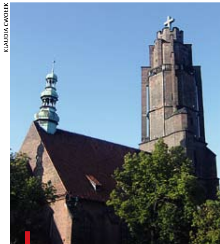
Na wieżę kościoła Wszystkich Świętych wchodzi się po stromych schodach

Zwiedzanie z przewodnikiem organizuje gliwicki Punkt Informacji Turystycznej i oddział PTTK. Wieża udostępniona jest dla turystów do końca września w każdą sobotę i niedzielę o godz. 16.00 i 17.00. Bilet kosztuje 4 zł. W tygodniu można też zamówić przewodnika dla grup, ale nie mniejszych niż 10 osób. Na miejscu dostępna jest wystawa dotycząca kościoła i historii Gliwic, a przewodnik dodatkowo opowiada o świątyni i obiektach widzianych z góry. Więcej informacji w Punkcie IT w Gliwicach, Rynek 11, tel. 32 231 05 76.