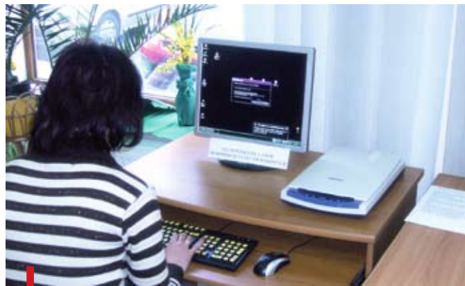
Specjalny komputer umożliwia słuchanie książek i gazet przez osoby z wadami wzroku