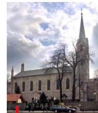
Ponad 200 tys. złotych przeznaczy gmina Zabrze na remont zabytkowego kościoła św. Andrzeja

Ponad 60 tys. zł. otrzyma parafia św. Józefa na wymianę drewnianego poddasza w koście-