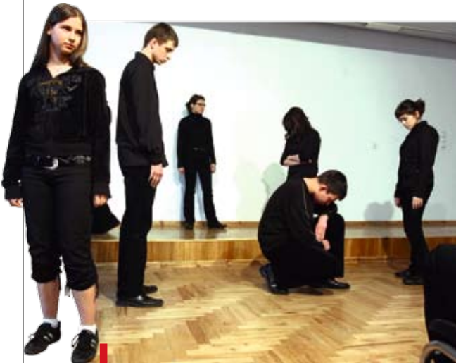
Uczniowie II LO w Gliwicach przygotowujący swoje przedstawienie w czasie zajęć kółka teatralnego

Od pełnego humoru przedstawienia przedszkolaków do występu licealistów, którzy ze sceny stawiali trudne pytania. Tak przebiegła gala VI Regionalnego Przeğerądu Inscenizacji Wielkanocnych.