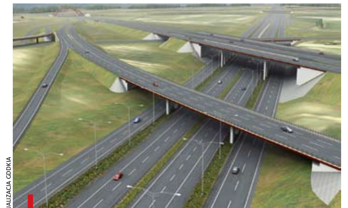
Węzeł „Sośnica” ma powstać w ciągu 17 miesięcy od rozpoczęcia budowy, jego koszt to ponad 850 mln zł