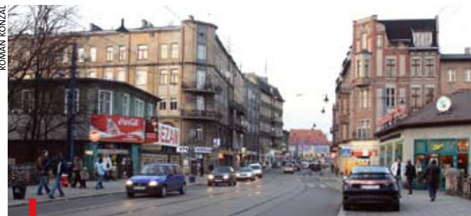
W przyszłości wokół gliwickiego dworca PKP ma powstać nowoczesne centrum miejskie