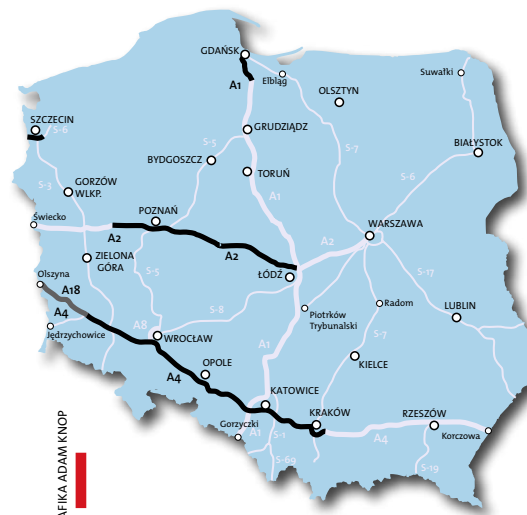
Autostrady – luty 2008; 699 km