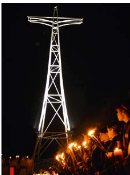
■ Czuwanie przy krzyżu papieskim w Zabrze

Wszystkie imprezy odbywają się w kinie Roma przy ul. Padlewskiego 4 w Zabrze. ■