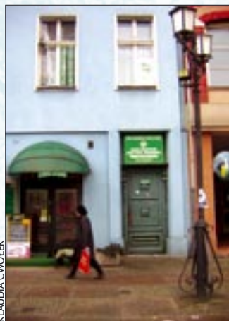
Siedziba gliwickiego oddziału PTTK znajduje się na pierwszym piętrze kamienicy przy Rynku II (wejście od Rynku 12)

PTTK. 21 lutego obchodzony był Światowy Dzień Przewodnika. Z tej okazji cykl specjalnych wycieczek zapro-