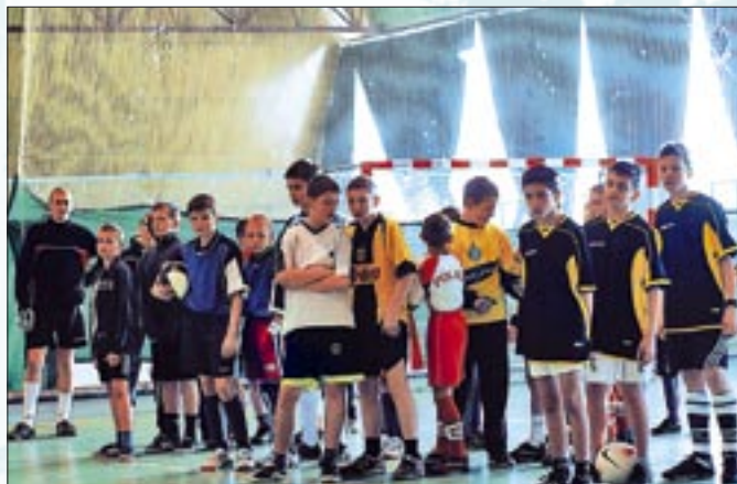
W hali zabrzańskiego MOSiR-u zmierzyły się drużyny dekanatu Gliwice-Sośnica. (na zdjęciu) Zawodnicy z najmłodszej grupy, w której rywalizowały parafie Miłosierdzia Bożego, Chrystusa Króla i św. Jacka