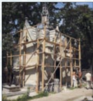
Prace przy mauzoleum rozpoczęły się dwa miesiące temu