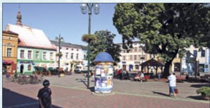
Co dzieje się na lublinieckim rynku, można zobaczyć w Internecie, na stronie www.lubliniec.pl

LUBLINIEC. Na rynku w Lublińcu działa już pierwszy HotSpot. Dzięki niemu każdy może skorzystać za darmo z Internetu, a na miejskiej stronie zobaczyć, co aktualnie dzieje się na głównym pl. K. Mańki. Na jednej z kamienic miejskiego rynku zainstalowano antenę nadawczą i każdy, kto przyjdzie na rynek z laptopem, palmtopem czy telefonem komórkowym wyposażonym w karty