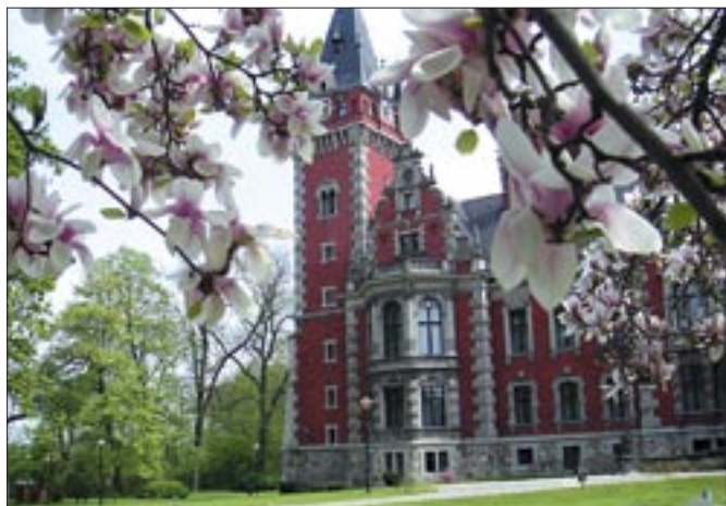
Farskie ogrody – Pławniowice