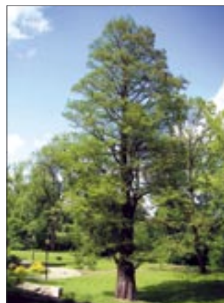
Cypryśnik błotny (na zdjęciu) jest jednym z największych w Polsce

Latem park tętni gwarem odwiedzających oraz koncertami, które odbywają się na wewnętrznym dziedzińcu. – Wszystkie prace wykonuję sam, czasem z pomocą gru-