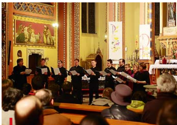
Tonus Peregrinus z Wielkiej Brytanii podczas koncertu (20 kwietnia) w kościele Trójcy Świętej w Bytomiu w ramach Festiwalu im. G. G. Gorczyckiego