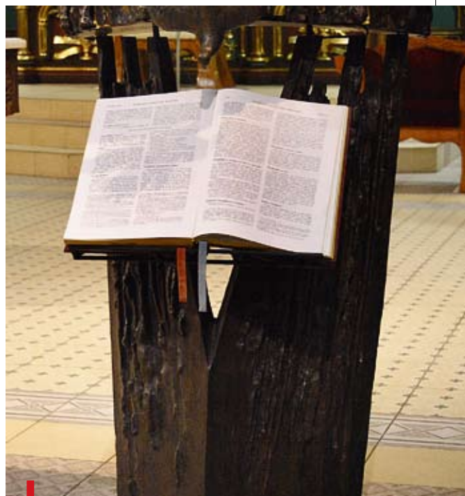
Adoracja Słowa Bożego w diecezji gliwickiej odbędzie się od 4 do 18 maja

– Tak jak практикуjemy czterdziestogodzinną adorację Najświętszego Sakramentu, tak chcemy, żeby było adorowane Słowo Boże. Często zapomina-