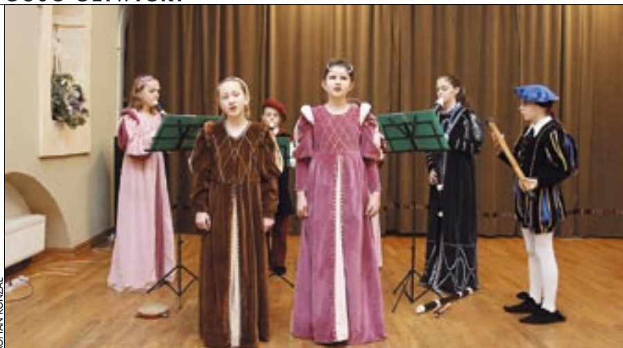
Na zamku w Toszku wystąpił Zespół Muzyki Dawnej „Tibiarum Scholares”