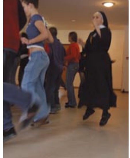
Na Ewangeliczne Rozliczenie razem z młodzieżą przyjeżdżają również siostry zakonne i księża

gliwickiego LO nr 2, która w tym roku wybiera się na Rozliczenie po raz trzeci. – Mam tam już znajomych, wiem, że będą na mnie czekać. Na pierwszym spotkaniu nie znałam nikogo, a mimo to czułam się bardzo dobrze. Jeżdżę na te spotkania, bo tam mogę dobrze zacząć nowy rok.