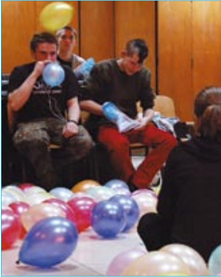
Grupa zajmująca się dekoracją sali pracuje od pierwszego dnia spotkania