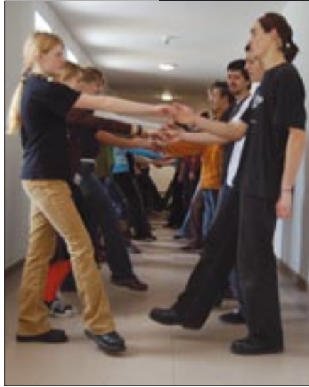
Zanim rozpocznie się bal, można poćwiczyć kroki na warsztatach tanecznych