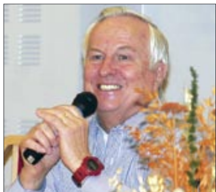
Josh McDowell podczas zeszłorocznego spotkania w Gliwicach

Już wkrótce na Śląsku gościć będzie Josh McDowell, pastor protestancki ze Stanów Zjednoczonych, wykładowca, autor wielu książek z dziedziny poradnictwa rodzinnego, wychowania i apologetyki.