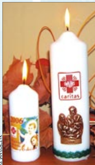
O świece można pytać w parafiach

WIGILIJNE DZIEŁO POMOCY DZIECIOM. Duże w cenie 10 zł i małe za 4 zł – jak co roku Caritas Diecezji Gliwickiej poprzez parafie rozprowadza świece na wigilijny stół. Dochód ze sprzedaży przeznaczony będzie na wsparcie potrzebujących dzieci.