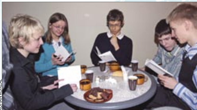
Młodzi poeci czytali swoje wiersze na spotkaniu w Centrum Jana Pawła II