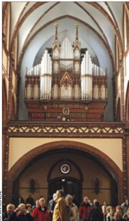
Organy w gliwickiej katedrze to 55-głosowy instrument zbudowany przez firmę Rieger

Wszelkie informacje o warunkach zatrudnienia i zakresie obowiązków można uzyskać w Referacie ds. Muzyki Kościelnej kurii w Gliwicach (wtorki w godz. 11.00–15.00 oraz w środy w godz. 9.00–13.00), tel.: 032 230 71 42, 602 190 887.