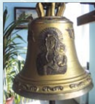
Dzwon popłynie do Afryki w kontenerze Stowarzyszenia Misji Afrykańskich