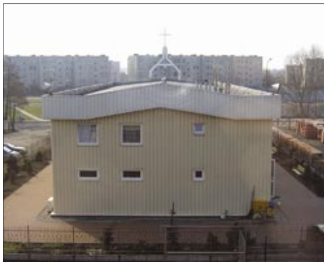
ZDJĘCIA KLAUDIA CWOŁEK