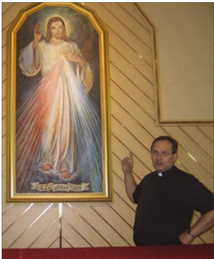
Na razie życie parafii koncentruje się w kaplicy, prawdopodobnie jeszcze w tym roku obok niej staną mury nowego kościoła