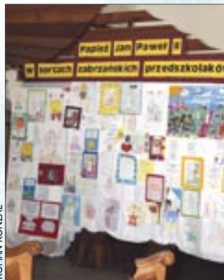
Przedszkolaki rysowały, pisały wiersze, lepily z masy solnej – wszystko dla Papieża