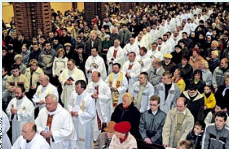
W Wielki Czwartek w gliwickiej katedrze modliło się ponad 150 księży