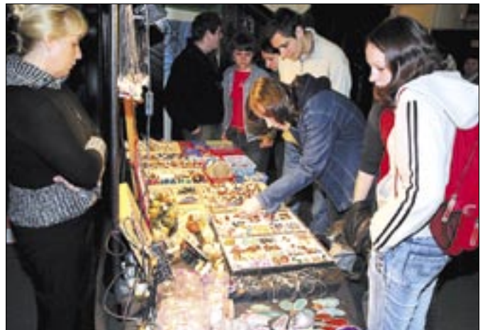
W holu Muzeum Górnictwa Węglowego można było kupić ciekawe minerały oraz wydawnictwa ekologiczne