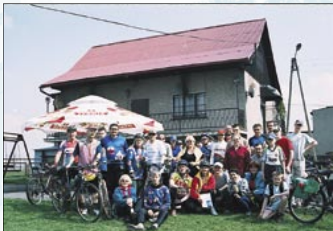
Organizatorem rajdu była Redakcja MTST „Cykloturysta” z Gliwic

drewniany kościółek św. Mikołaja, którego początki sięgają 1480 roku. Po zwiedzeniu drewnianej świątyni rowerzyści wzięli udział na boisku w konkursie „Rowery tor przeszkód”. Rywalizacja odbywała się w trzech kategoriach. Na zakończenie zwycięzcom wręczono dyplomy i nagrody rzeczowe.