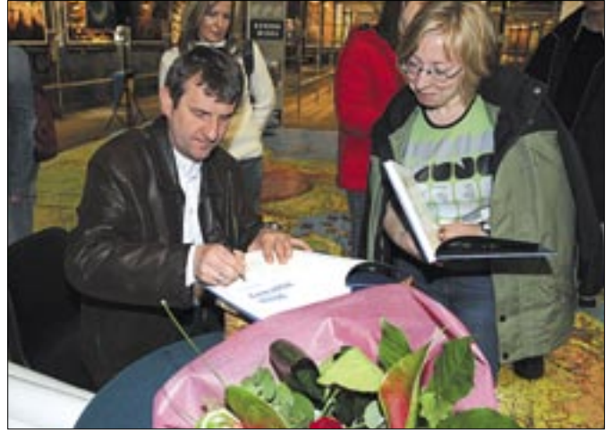
W ramach Tygodnia Ziemi odbyło się spotkanie z Markiem Kamińskim, znanym polarnikiem, który opowiadał m.in. o pieszych wędrowniach na oba bieguny Ziemi