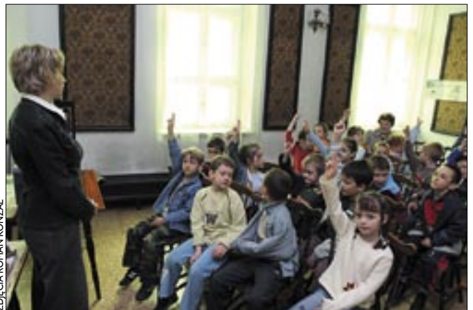
Warsztaty ekologiczne odbywały się w trzech salach zabrzańskiego Muzeum Górnictwa Węglowego. Cieszyły się ogromnym powodzeniem.