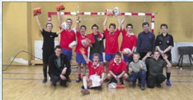
Zwycięzcy rywalizacji w grupie starszej – ministranci z par. św. Stanisława Kostki w Lublińcu